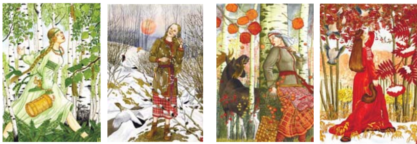
Рис. 9. Картины Н. Фомина из серии «Деревья»

Природа Сибири... А если богаче? Где кедры, как в зеркало, смотрятся в небо, Где ивы и вербы над речкою плачут. Меня не поймет только тот, кто там не был. Природа Сибири чудесна... не скрою, А если уедешь, то точно вернешься К тем родникам с ключевой водою, Которую пьешь и никак не напьешься. Все лето природа щедра разнотравьем, И может быть, край этот кажется диким, Я много отдам за одно лишь желанье Почувствовать вкус переспелой брусники.